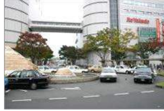
③ 駅を出るとロータリーがあり、目の前にイトーヨーカドーが見えます。