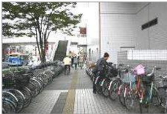
⑤すすんでいくと、歩道橋が見えてきます。