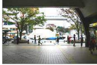
② 東口を向いた景色。 そのまま駅を出てください。