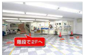
建物の前には4 台の駐車場スペースがあります。