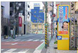
⑩道路の右手に看板があります。武蔵野銀行草加支店の斜め向いです。