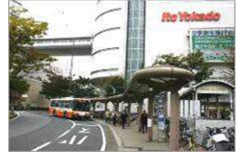
④イトーヨーカドー側の道を進んで下さい