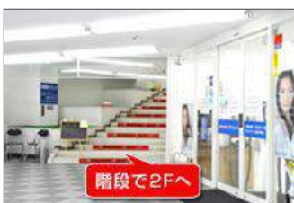
1Fのメガネ&コンタクト店の横の階段を2階へ上がってください。