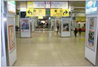
① 草加駅構内です。 東口の方へお願いします。