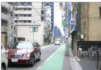
⑨右折後、さらに100直進