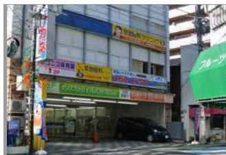
2F 草加眼科クリニック 1F メガネ&コンタクト店 武蔵野銀行から見た外観です。