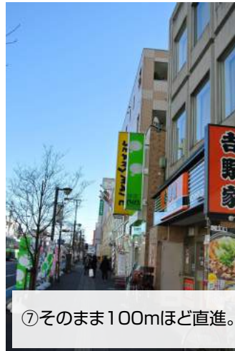
⑦そのまま100mほど直進。