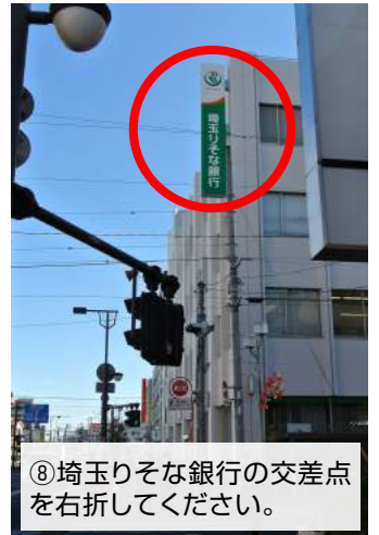
⑧埼玉りそな銀行の交差点を右折してください。