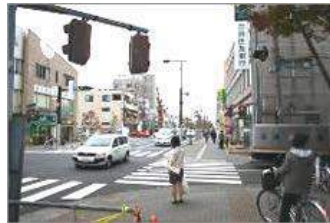
⑥更に進むと三井住友銀行があります。その交差点を直進してください。